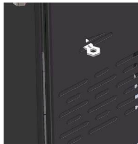
Регулятор вторичного воздуха – слева